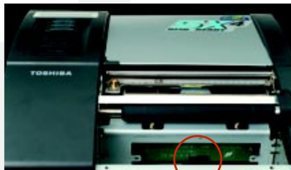
▲ Antena RFID UHF